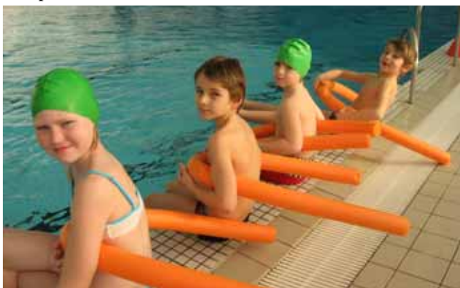
□ Plavecký výcvik ve Znojmě, únor – duben 2016

Výuka plavání byla podpořena finančními prostředky z rozpočtu obce dvanácti tisíci korunami.