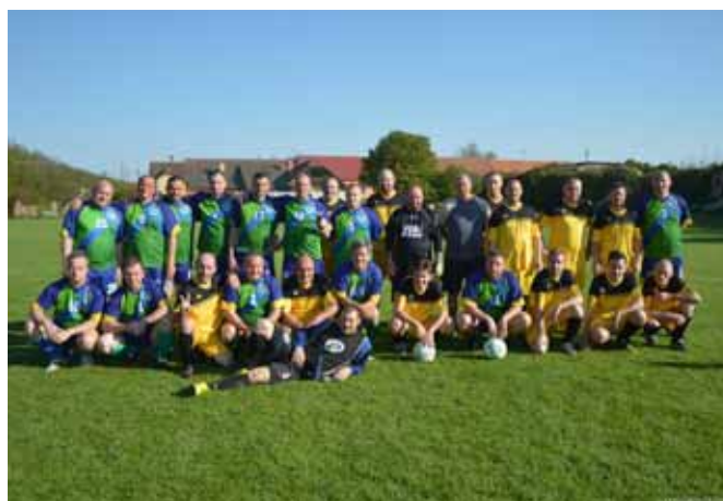
☐ Staří páni Vedrovice vs Vysoká pri Morave