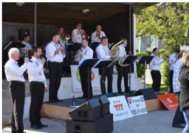
☐ DH Dubňanka