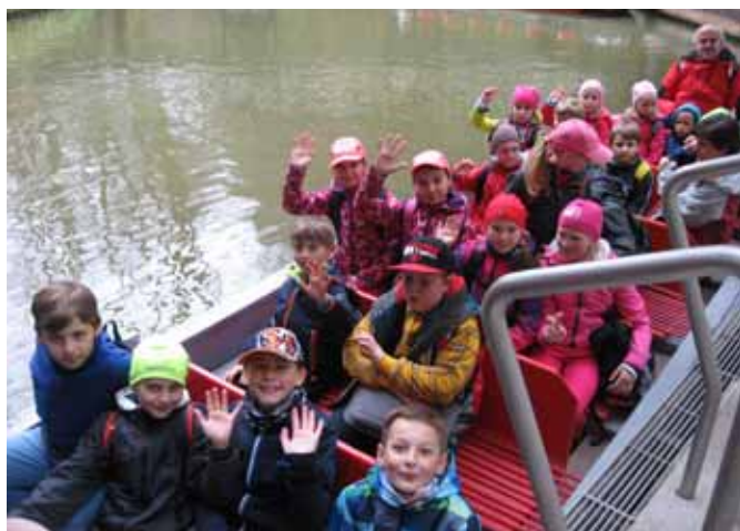
□ Pluli jsme po řece Punkvě, 12. 4. 2016