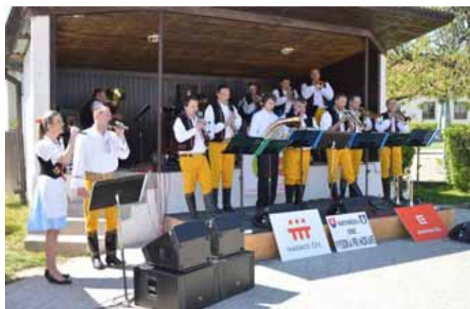
☐ DH Horané