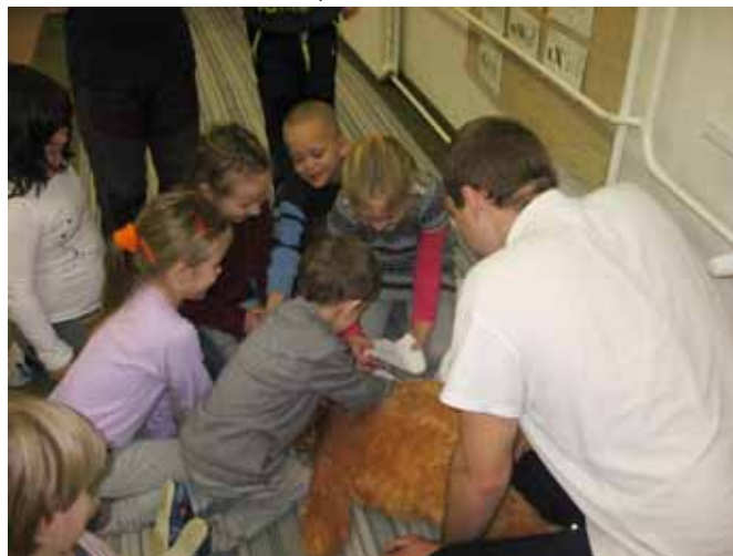
□ Jak poskytnout první pomoc, 17. 2. 2016

Někdy v životě se nám může stát, že se poraníme, zlomíme nohu, popálíme nebo se setkáme s člověkem v bezvědomí. Co udělat, jak se zachovat, jak poskytnout první pomoc zraněnému, jsme si povídali, my prvňáci a druháci, se záchranářem ze zdravotní záchranné služby v naší škole.