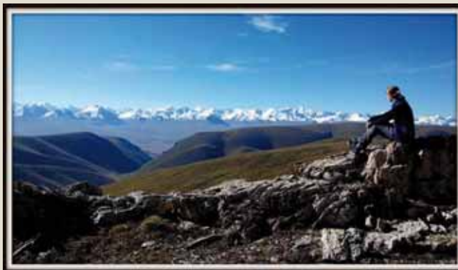
Ťan Šan – nebeské hory