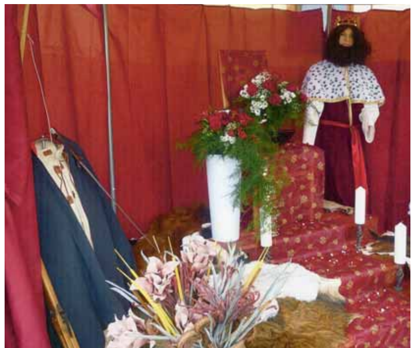
□ Karel IV. rád zahradničil