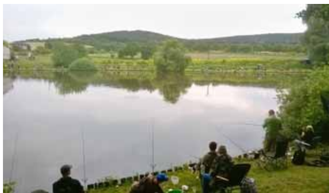
□ Rybářské závody 2015

Bližší informace k závodům, včetně pravidel, naleznete na webových stránkách Rybářského spolku Vedrovic: http://www.rybarivedrovic.websnadno.cz/Zavody.html