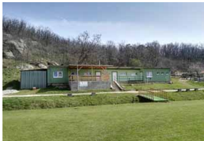
□ Pergola s novou fasádou kabin