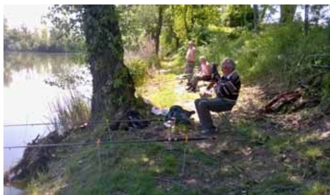
□ Rybáři z Vedrovic