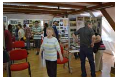
❑ Výstava fotografií - Vedrovice v proměnách času