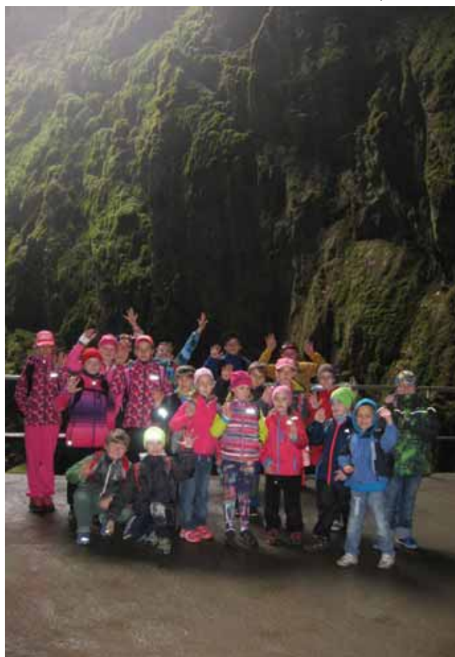
□ Navštívili jsme Macochu, 12. 4. 2016