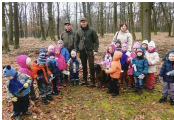
□ Exkurze na polesí