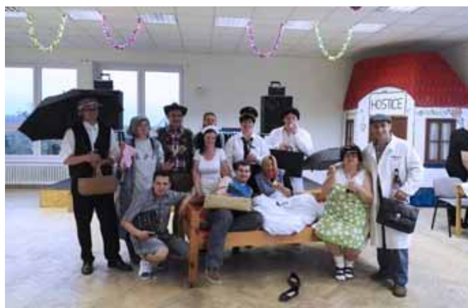
☐ Retro párty