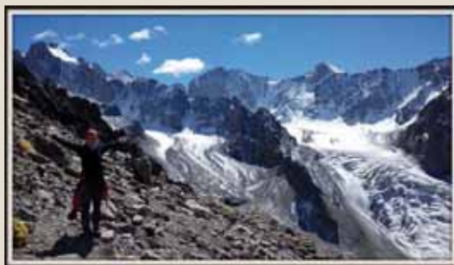
NP Ala Arča