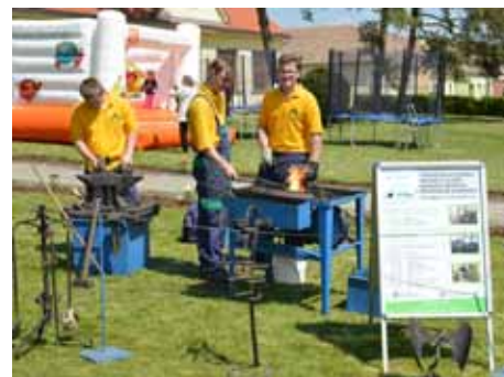
❑ Řemeslný Jarmark - zemědělské učiliště