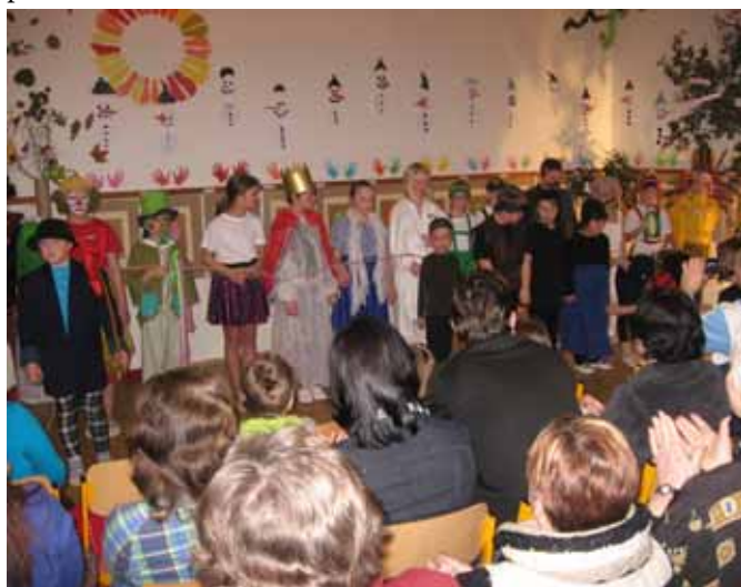
□ Jarní setkání v základní škole, 22. 3. 2016

Jemné, odvážné, moudré vystoupení provázené hudbou kontrabasů a tanečním uměním malých umělců, obohacené o veselé básničky a písničky bylo příjemně stráveným jarním podvečerem v naší škole...