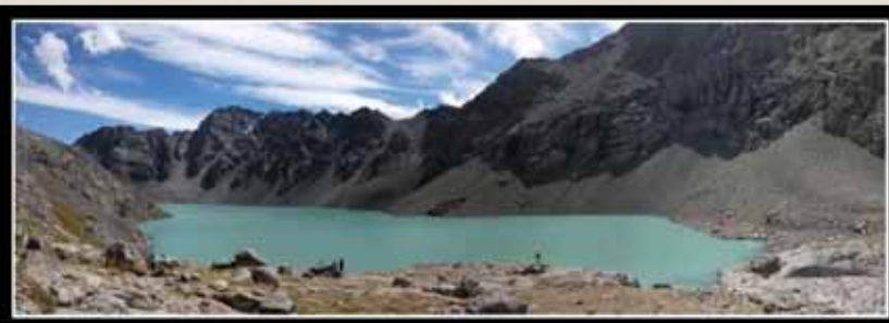
Jezero Ala Kul