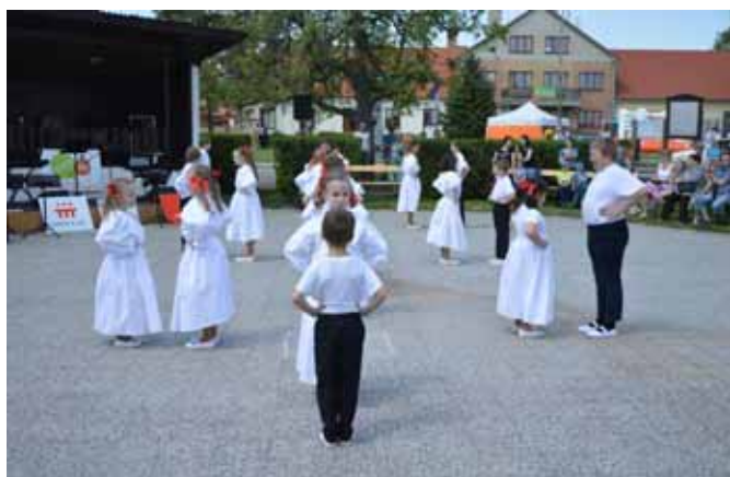
☐ Děti ze ZŠ Vedrovice