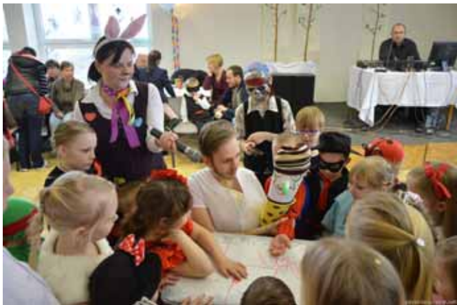
□ Maškarní ples 2016

Již třetím rokem jsem členkou výboru rodičovského sdružení, z toho dva jsem byla jeho předsedkyní.