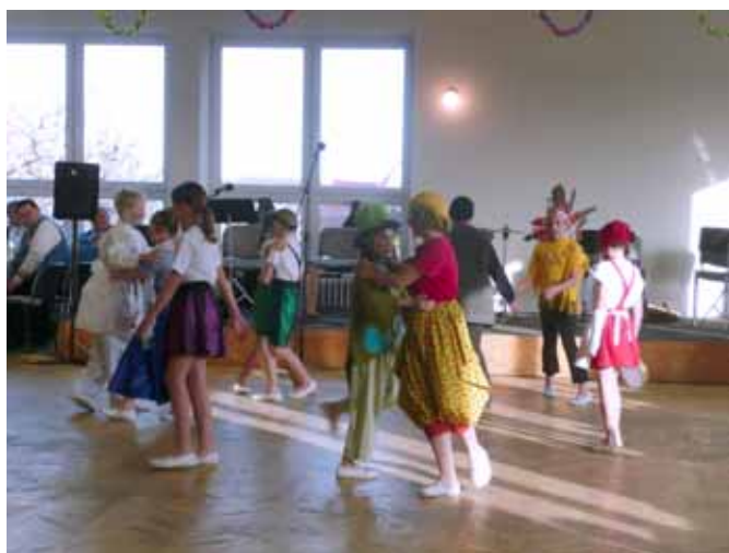
□ Hráli jsme, tančili a zpívali pro radost našim babičkám a dědečkům, 22. 4. 2016

Hráli jsme, zpívali a tančili pro radost našim babičkám a dědečkům v sále kulturního domu ve Vedrovicích...