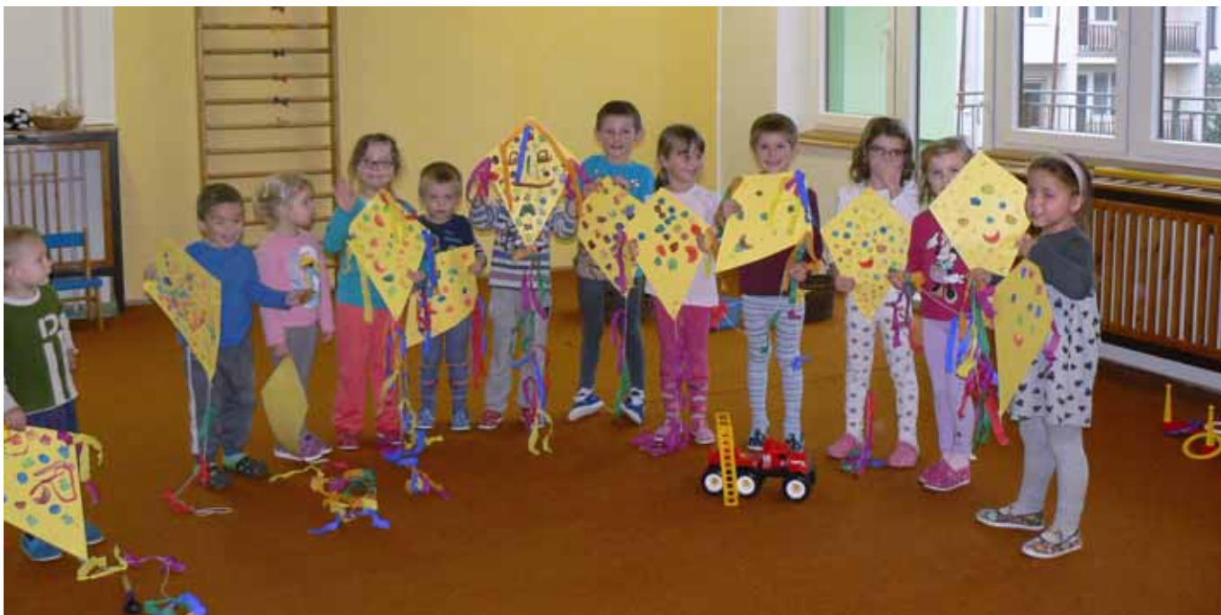
□ Drakiáda 2015