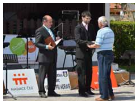
❑ Ocenění ZO Vedrovice