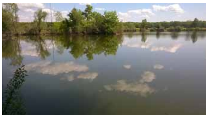
□ Ostrov na Velkém Axi