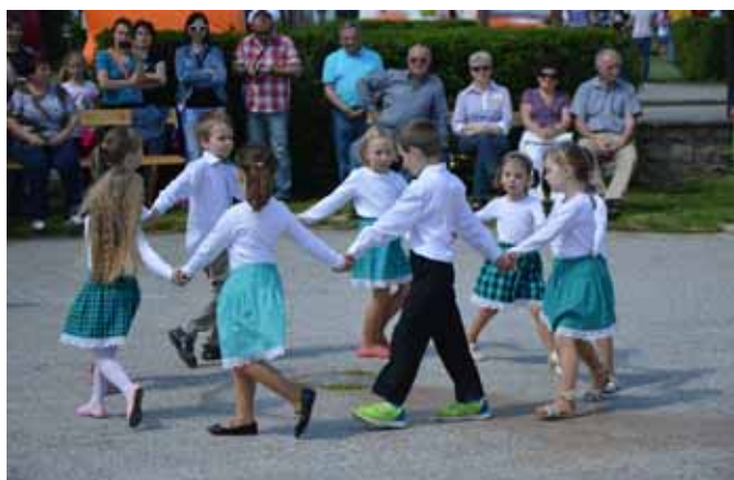
☐ Děti z MŠ Vedrovice