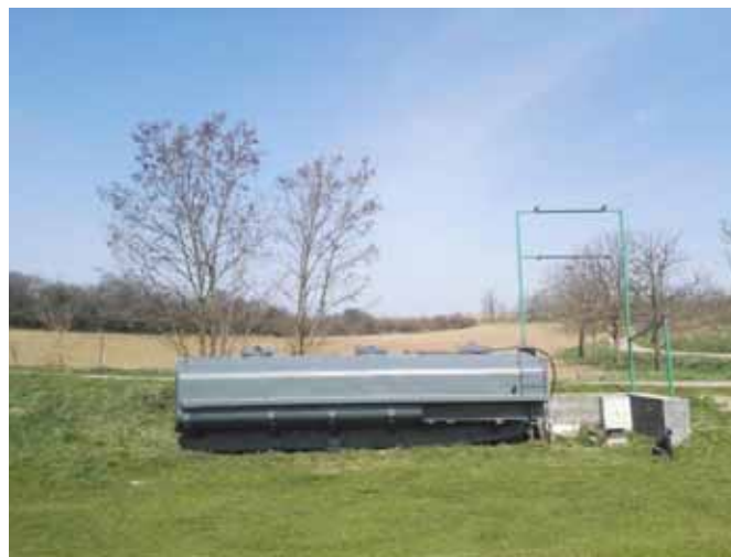
□ Nově natřena nádrž s držákem pro tabuli