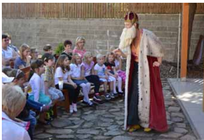
☐ Divadlo Koráb - Princezna s dlouhým nosem