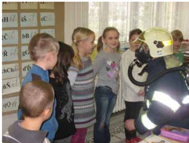
□ Hasiči ve škole, 10. 3. 2016

Sdíleli jsme své dosavadní zkušenosti co udělat v oblasti požární ochrany a ochrany obyvatelstva u nás doma, aby náš život byl bezpečnější a příjemnější...