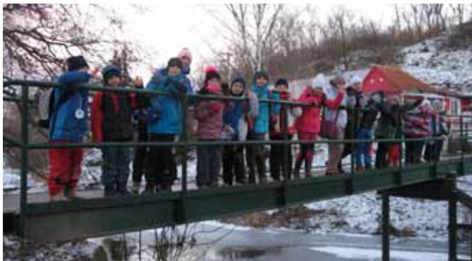
□ Bruslili jsme na krumlovském rybníce, 4. 2. 2016

a užili jsme si „ledových“ radovánek na krumlovském rybníce...