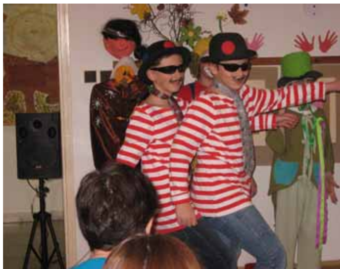
□ Hráli jsme loupežnickou pohádku od Josefa Čapka, 22. 3. 2016