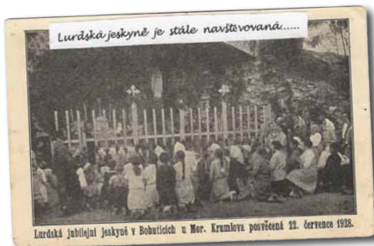
Lurdská jubilejní jeskyně v Bobuticích u Mor. Krumlova posvěcená 22. července 1928.