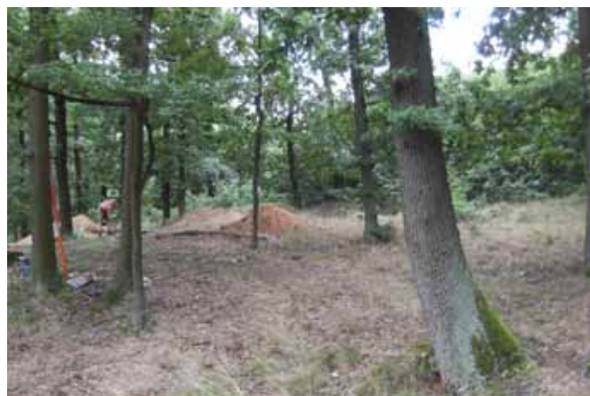
□ Zbytky mohutné kráterovité těžby z doby bronzové na vrcholu hřbítku

To ovšem neznamená, že bychom pro takové zvláštní pohyby pravěkých lidí již neměli hledat analogie. Nalezneme je už na samotném prahu neolitu, a to v Turecku. Tam byly na lokalitě Göbekli Tepe a Nevalı Çori asi před 9 tisíci lety do kruhových půdorysů vztýčeny stovky několik m dlouhých