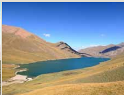
Jezero Kul Ukuk