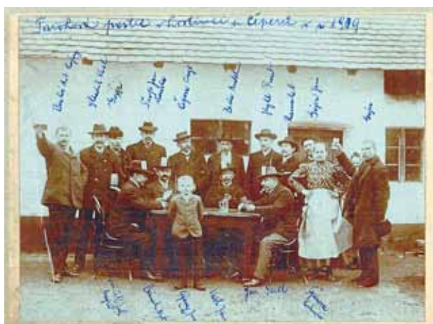
□ Taroková partie v hostinci u Čeperů v roce 1909