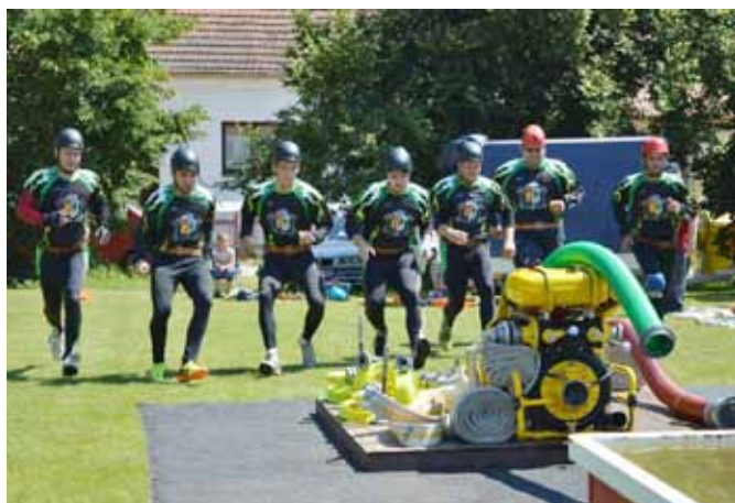
□ Domácí družstvo na startu