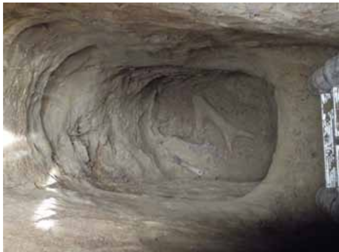
□ Rypadlo z kapitálního parohu pod haldou ze starší doby bronzové

Dělo se toho mnoho. V první řadě jsme nemohli sehnat brigádníky a auto, takže většina úsilí byla po celou dobu výzkumu věnována doptávání u různých institucí a známých. Jako naschvál zrovna vypověděl ve vedrovickém muzejíčku i internet. Nakonec se úderka jakž takž sestavila, i když po dva dny měla jen jednoho člena, před nímž mně bylo hanba psát si jen něco do sešitu a neházet lopatou. Nejsem však už nejmladší a stud jsem překonal.