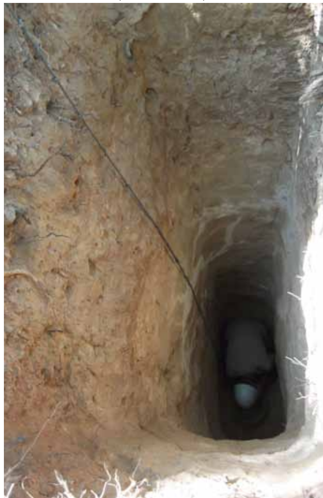
□ Obr. 2. Jak hluboko jsme museli kopat (a nedokopali se).

souviset stařina pod mnohem staršími mezolitickými ohništi? Druhé, o něco starší eneolitické datum takovým překvapením nebylo, protože pocházelo z vršku oněch hnědých svahových sedimentů a svědčilo pouze o tom, že ve svrchních polohách se v téže haldě může vyskytovat něco mladšího, aniž bychom to mohli podle charakteru štípané industrie rozpoznat. Proto jsme se rozhodli tuto dolní sondu prohloubit až na dno a nechat datovat nejhlubší uhlíky. Ty jsme skutečně získali, stejně jako paroh a zlomek parohového kopáče. Vzorky ale zatím nebyly do Oxfordu ani zaslány, natož datovány.