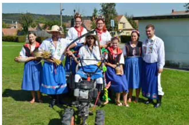
□ Trešón 2016