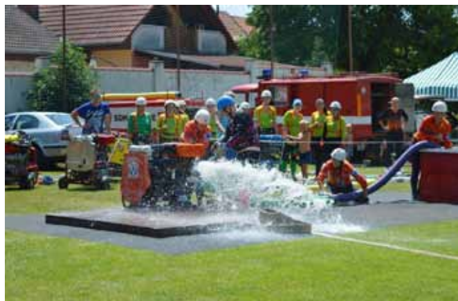
□ Ne vždy útok vyjde