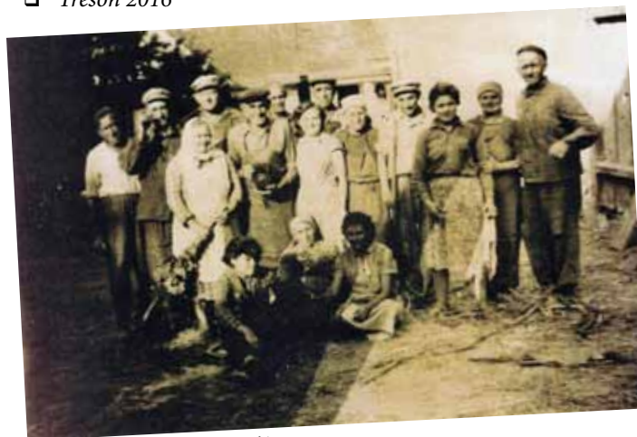
□ Domlatky u Novosádů