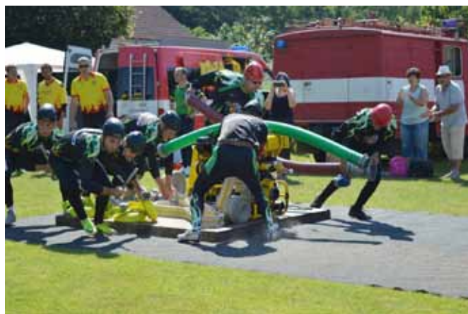
□ Domácí v akci