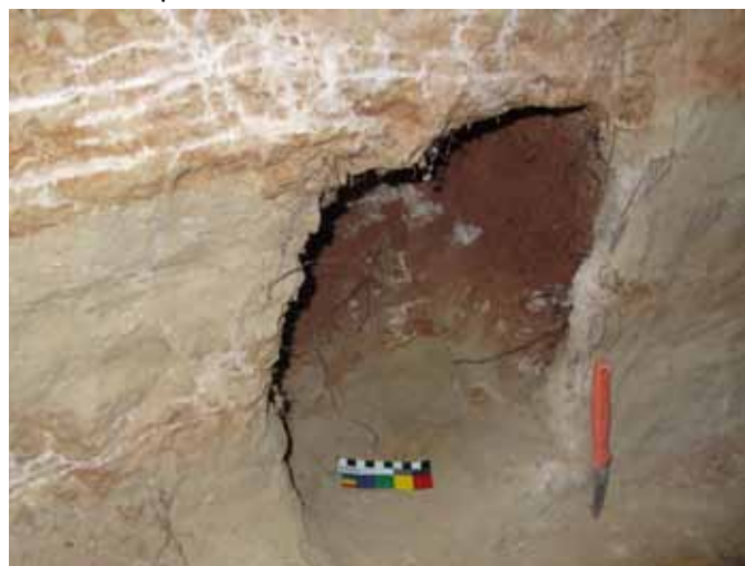
□ Jak jsme se při čištění profilu haldou proškrábali do sousední šachty.

To ovšem neznamená, že bychom pro takové zvláštní pohyby pravěkých lidí již neměli hledat analogie. Nalezneme je už na samotném prahu neolitu, a to v Turecku. Tam byly na lokalitě Göbekli Tepe a Nevalı Çori asi před 9 tisíci lety do kruhových půdorysů vztýčeny stovky několik m dlouhých