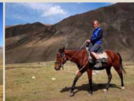
V horách na koních