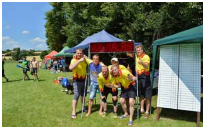
□ Vítězové mužské kategorie SDH Jezeřany-Maršovice