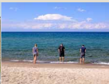
Jezero Issyk Kul