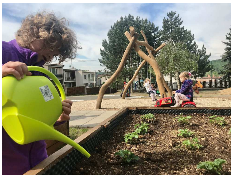
Vyvýšený záhon – péče o jahody

Děti v MŠ Vedrovice, díky realizovanému projektu s podporou dotace, získaly novou zahradu v přírodním stylu obohacenou o funkční herní prvky. Tato školní zahrada, je místem setkávání pro rodiny s dětmi, místem, kde se děti denně setkávají s přírodou a budou mít možnost se o přírodě učit přirozeným způsobem a prožitkem, kde pobyt a pohyb je v souladu s přirozenými potřebami dětí. Náplň prvků v této zahradě reaguje na proměny přírody v průběhu roku a nabízí dětem podněty k pozorování i různým aktivitám. Pestrá a proměnlivá zahrada bude pozitivně ovlivňovat sociální chování, tvořivost a celkovou osobnost dítěte.