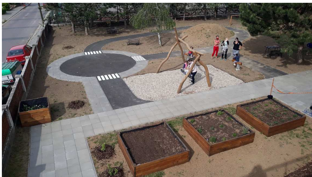
Vyvýšené záhony, herní prvky a dopravní hřiště tvoří jeden funkční celek