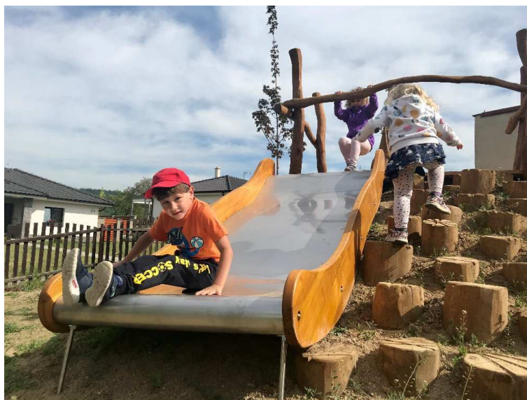
Funkční herní prvky rozvíjí motoriku dětí