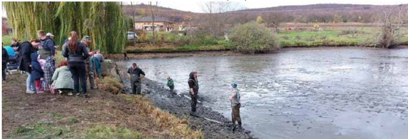
☐ Výlov rybníka 05.11.2022