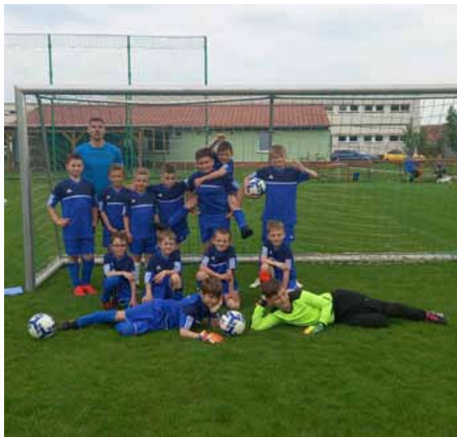
□ Přípravek fotbalisti

Další zajímavou zmínkou je, že od ledna nového roku proběhly přípravy na 5. ročník sportovního plesu, který se uskutečnil po dvouleté covidové pauze v sobotu 18.3.2023 v místním kulturním domě. Naši nadějní sportovci z mládeže si na tento ples připravili taneční vystoupení, které mělo dvě části. V první části vystoupení tančily nejmenší děti a ve druhé