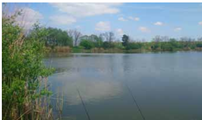
□ Rybářský revír Velké Axi