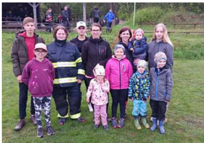
□ Naše sestava i s fanoušky

A proč se soutěž jmenuje „Železný kačer?“ Záhada nám byla objasněna na vyhlášení soutěže. Vítězové dostávali mražené kachny :-)