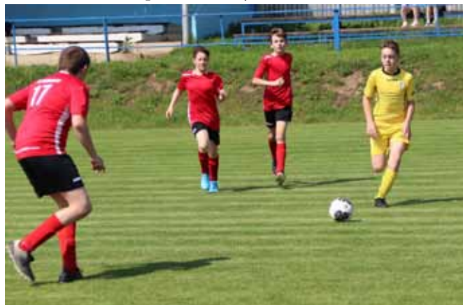
□ Žáci fotbalisti

části se naše dospívající mládež prezentovala společenským tancem Chacha. Ples nabídl bohatou tombolu, kapelu STONE, kulturní zážitek a spoustu zábavy.