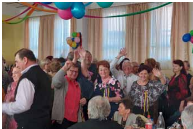
□ Ženský chmat

Jako vždy se v místním v kulturním domě sešly delegace Jednot důchodců z celého okresu Malacky, které doplnili zástupci našeho Klubu seniorů.