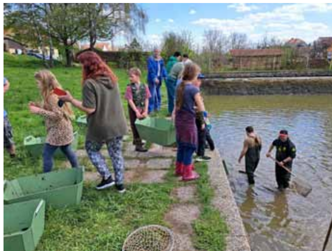
☐ Výlov koupaliště 15.04.2023