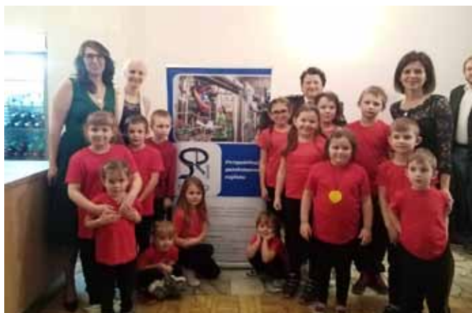
□ Vlasatice - Hasičský ples s vystoupením našich dětí