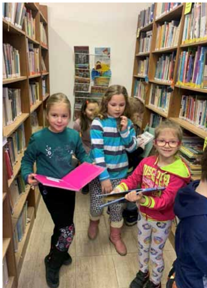
□ Knihovna - Noc s Andersenem