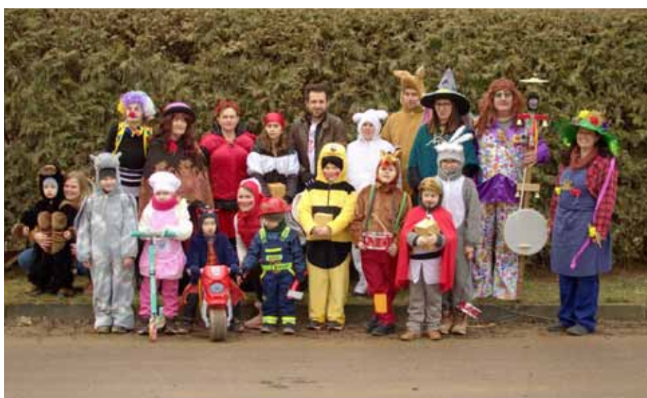
☐ Masopust 18.2.