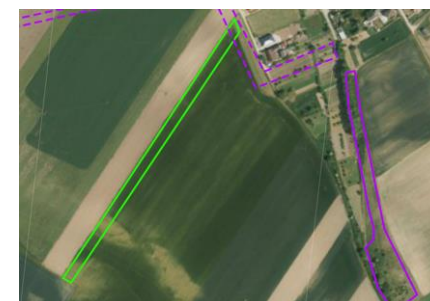
Ortofoto mapa se zákresem opatření