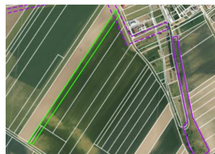
Ortofoto s katastrální mapou (mapy.cz)