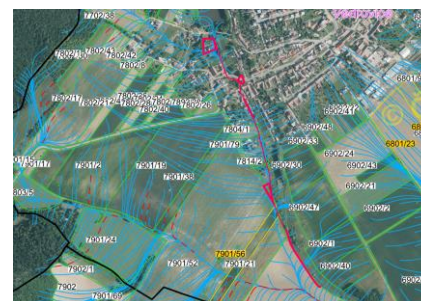
Odtokové linie (LPIS)