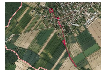
Ortofoto mapa (geoportal.cz)