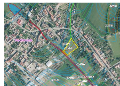
Odtokové linie (LPIS)