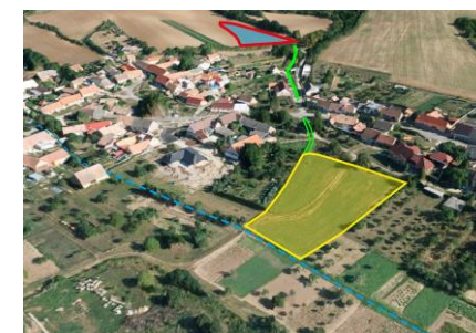
3D pohled