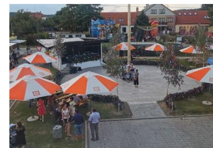
Využití veřejného prostoru