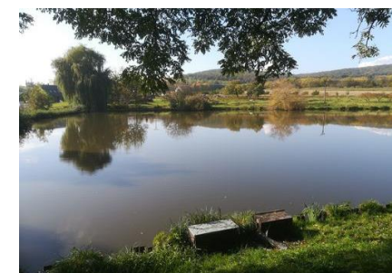
Aktuální stav (mapy.cz)