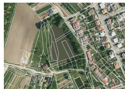
Ortofoto katastrální mapa (mapy.cz)